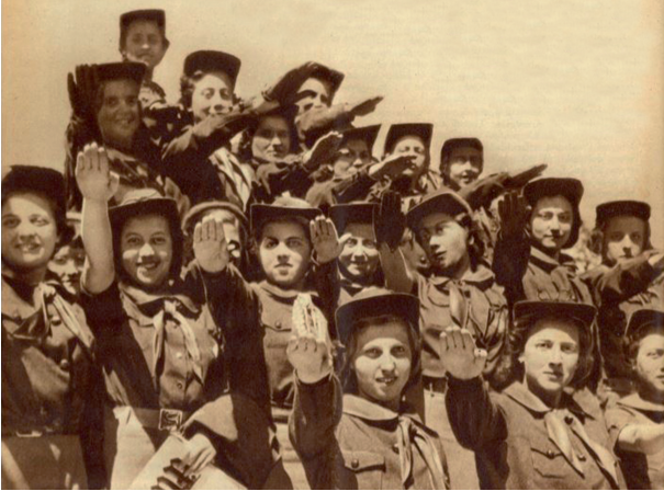
A – Fundação da Mocidade Portuguesa Feminina.