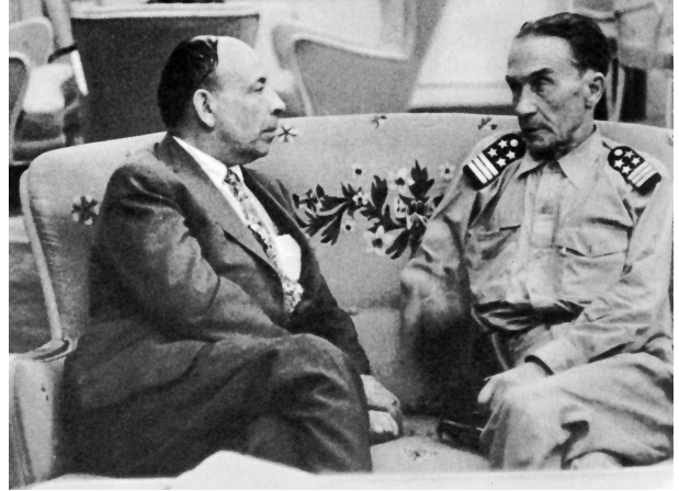
B – Humberto Delgado e Henrique Galvão a bordo do paquete Santa Maria .