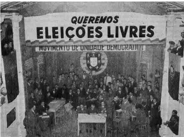
C – Sessão do MUD no Teatro Taborda, Lisboa.