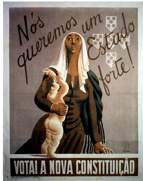
D – Plebiscito à Constituição do Estado Novo.